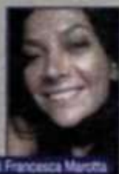
di Francesca Merzetti

Anche se evoca una gestualità rétro, oggi è richiestissima. Rispetto al passato le sue prestazioni sono rinnovate grazie a formule delicate, che si prendono cura della tua igiene dalla testa ai piedi