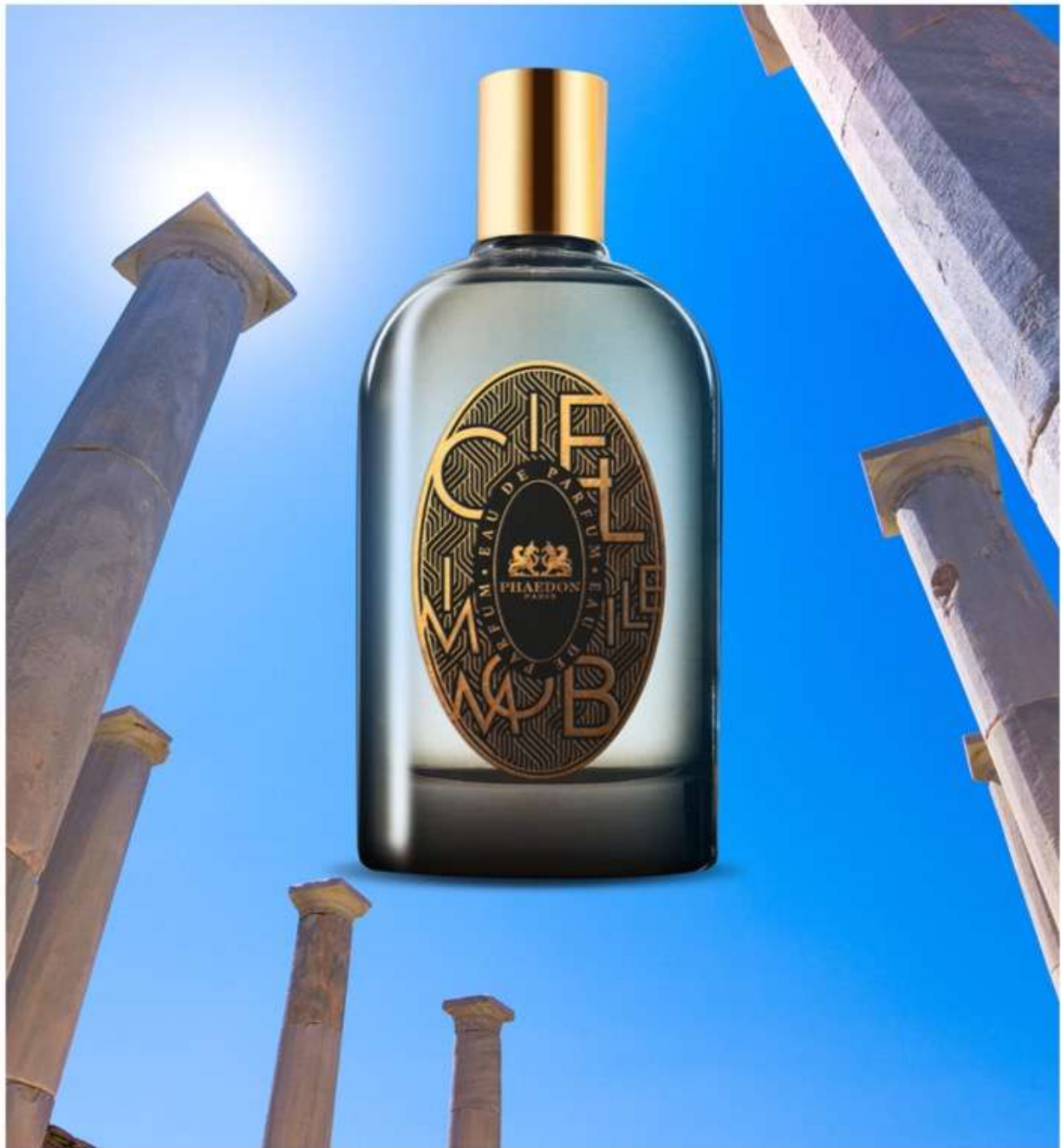
Phaedon Paris-Ciel Immobile

Una fragranza floreale, fruttata, mineralica ispirata ad una Delos antica e alle sue bellezze. Isola dal paesaggio arido, chiunque vi faccia arrivo è accolto da un profumo di fiori di capperò e legno di fico. Un luogo in cui il tempo sembra essersi fermato in un immobile cielo, azzurro imprigionato per sempre da legami in cuoio, riscaldati da un sole ardente.