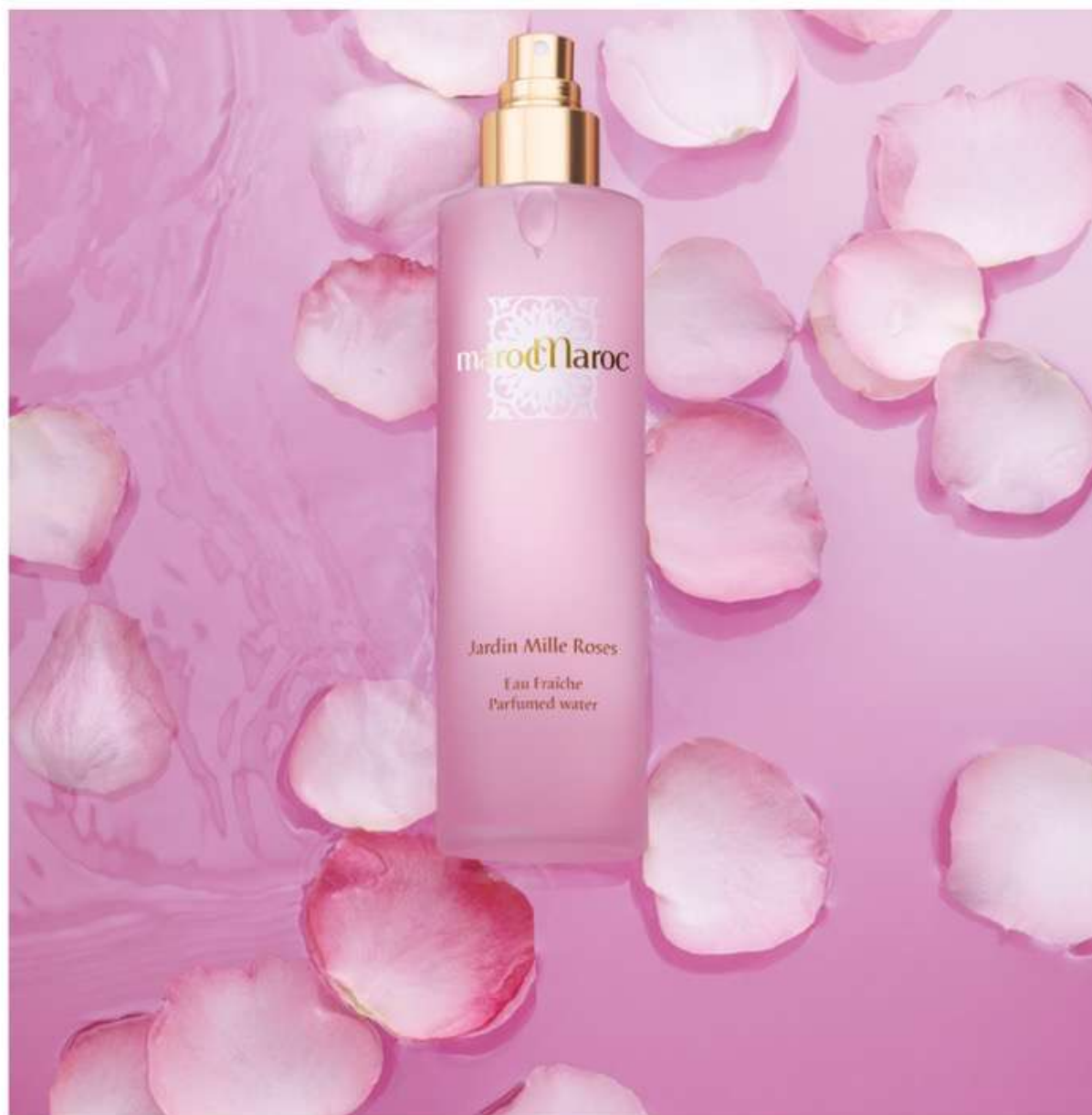
MaroCmaroC-Jardin Mille Roses

Tutte le virtù della Rosa racchiuse in un'acqua profumata a metà tra una nebbia delicata e una fragrante pioggerellina: la morbidezza sulla pelle e la personalità olfattiva dalle molteplici sfaccettature in cui spicca un lato zuccherino. Ispirata ai rituali marocchini, dove l'acqua di rose viene vaporizzata per tonificare la pelle prima di lasciare l'hammam, è come un prezioso souvenir che rivela lentamente tutto il suo fascino segreto. Sin dalla prima applicazione la pelle risulterà morbida e tonica, avvolta da un velo leggero dal profumo seducente. Con note Lampone, Lokoum, sentori di Rosa Centifolia e Canina, quest'acqua floreale vi farà viaggiare con la mente.