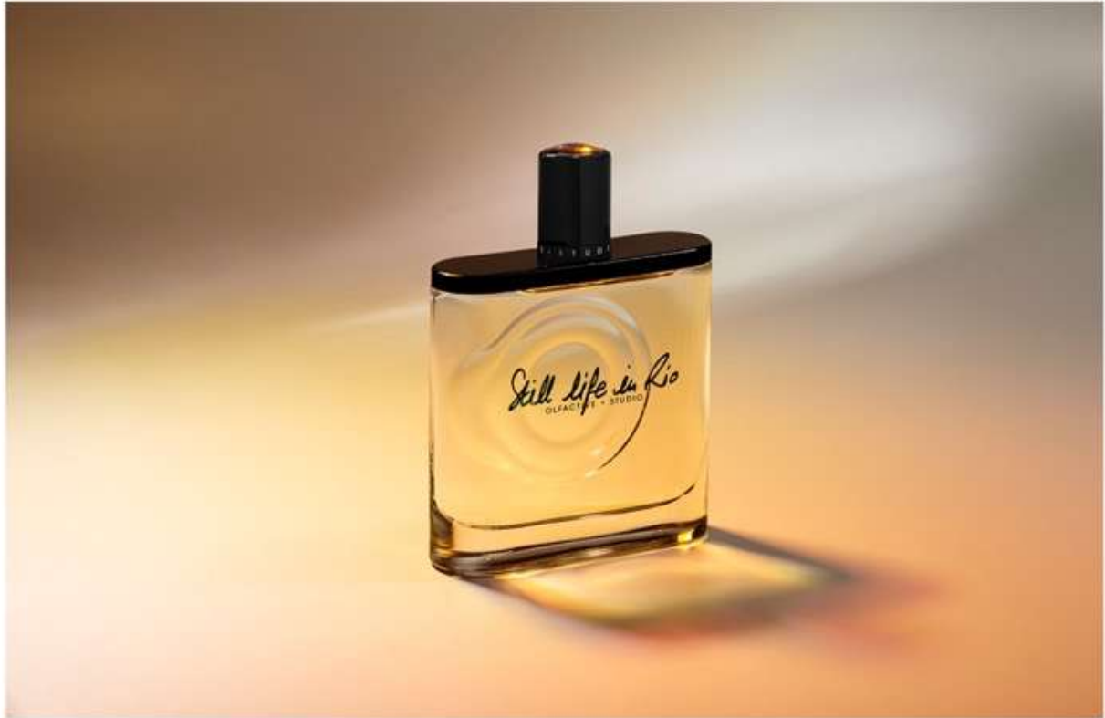
Olfactive Studio-Still Life in Rio

Esotico e luminoso, Still Life in Rio è un nuovo cocktail inedito che si apre con note di yuzu, zenzero, menta ed essenza di limone; si sviluppa e riscalda con un accordo di pepe, peperoncino piccante e acqua di cocco, con sovrastanti note di rum e legno di copahu brasiliano.