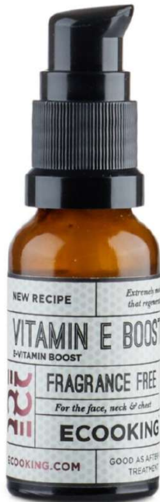
Vitamin E Boost, Ecooking

Il Vitamin E Boost è l'evoluzione del Siero trattamento iconico della stessa linea perché possiede le stesse efficaci proprietà e fornisce una maggiore idratazione alla pelle grazie ai suoi numerosi antiossidanti . Questa nuova formula contiene un'elevata concentrazione di vitamina E , che lenisce efficacemente la pelle e aiuta a rigenerarla. Grazie all'aggiunta di oli nutrienti e idratanti, come l'olio di karité e olio di germe di grano, che trattengono l'umidità nella pelle, l'aspetto del viso appare più nutrito e quindi anche più sano.