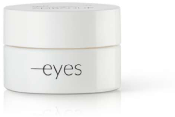
Eyes Golden Edition, Ambadué

Questo prodotto è più che un prodotto di make up è un prodotto di skincare perché utilizza tutte le potenzialità di un trattamento per contorno occhi per dare al vostro make up un risultato strepitoso per lungo tempo. Esso ha un'azione protettiva, idratante e che minimizzagli effetti del tempo in modo estremamente lussuoso grazie agli ingredienti come l' oro colloidale e peptidi che lavorano in sinergia con acido ialuronico in differenti pesi molecolari. E' molto efficace e mirata azione sulle rughe e sulla elasticità cutanea.