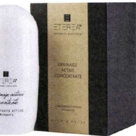
ETEREA COSMESI drainage active concentrate (€25,00)