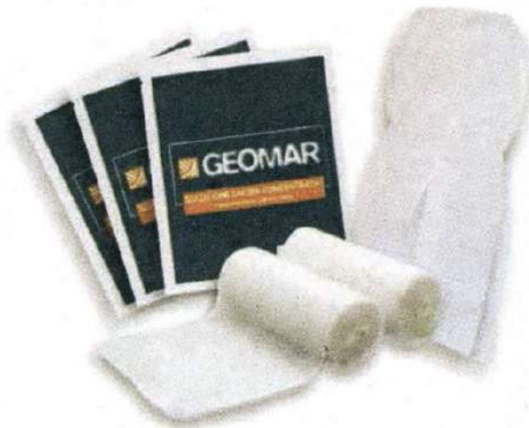
GEOMAR kit bende drenanti gambe (€13,90)