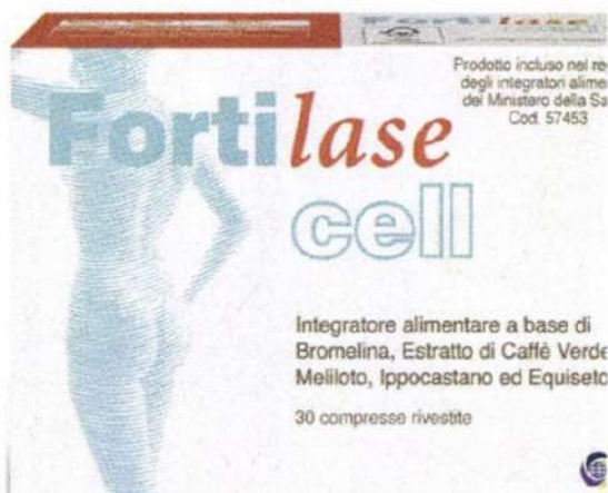
VIATRIS Fortilase Cell integratore alimentare (€30,90)

AQUARDENS TERME DI VERONA nella sauna, la più grande d'Italia viene eseguito il rituale dell'Aufguss, una tecnica del Nord Europa praticata da specializzati Aufgussmeister (maestri di sauna) che, con movimenti ritmici dei teli e accompagnati dalla musica, dirigono verso gli ospiti i vapori caldi degli oli essenziali naturali scaldati dai bracieri. Il rituale, infatti, come da tradizione, prevede che sopra i carboni vengano disposte sfere di ghiaccio aromatizzato con oli essenziali che, grazie al movimento dei Aufgussmeister aromatizzano gli spazi portando benefici come il rilassamento muscolare, la stimolazione del sistema linfatico e l'eliminazione delle tossine www.aquardens.it