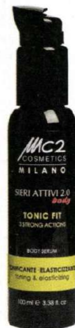
MC2 cosmetics MILAN siero attivo formulato con ginseng siberiano (€75,00)