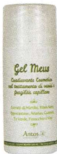
ANTOS gel fresco e riposante per le gambe. Migliora la circolazione e dona un senso di benessere (€14,50)