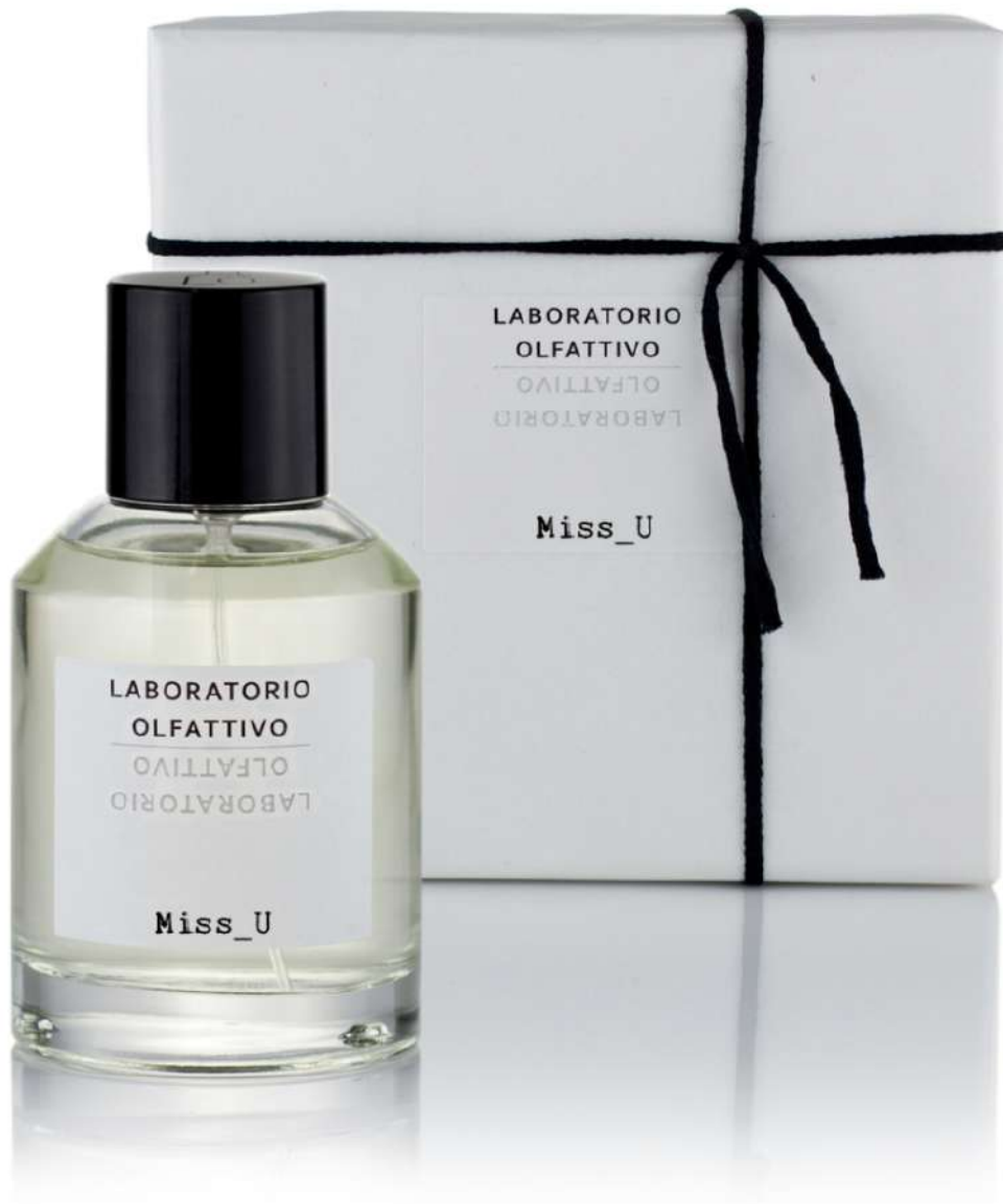
Miss_U Eau de Parfum, Laboratorio Olfattivo