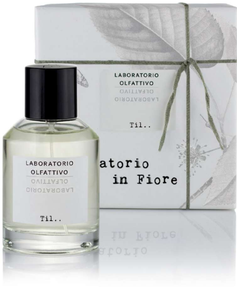
Til Eau de Parfum, Laboratorio Olfattivo

Til, altra novità della griffe, ha invece ha il magnifico potere di catapultare chi la vaporizza sulla pelle in un'atmosfera di impazienza per l'inizio delle vacanze, cadenzata dai primi raggi di sole, distinguendosi così come un jus capace di comunicare un autentico senso di gioia.