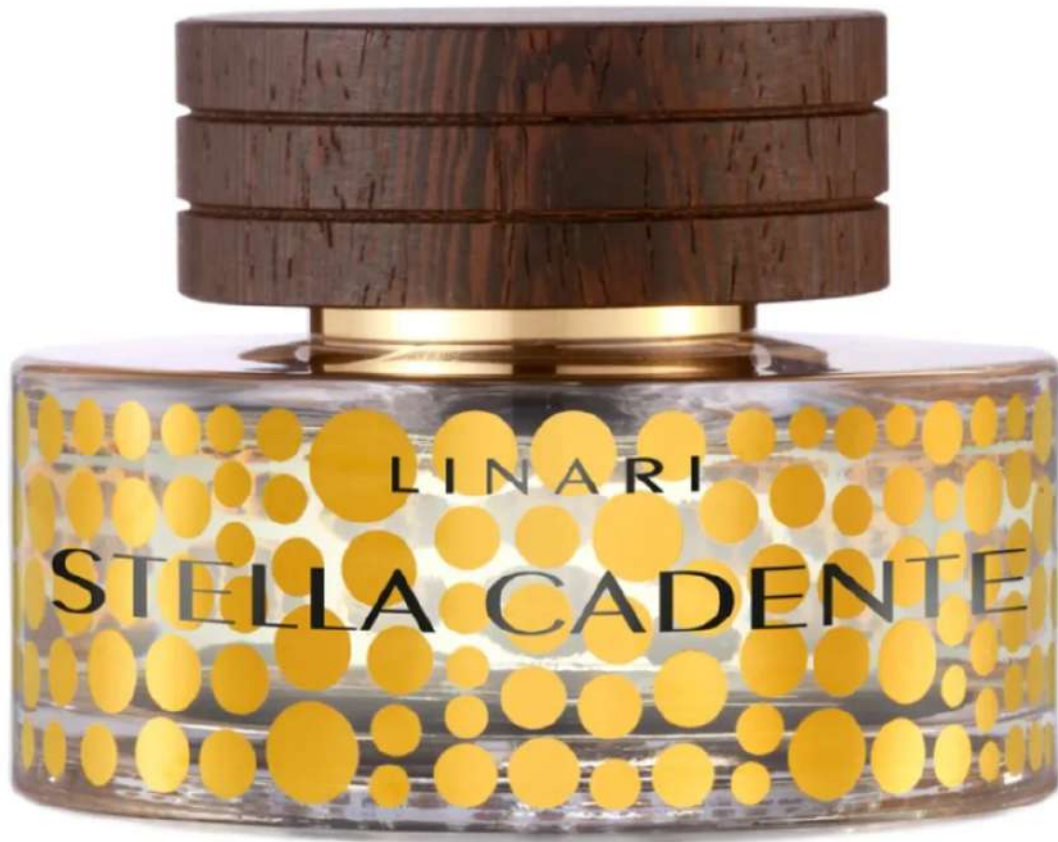
Stella Cadente di Linari

Stella cadente è ispirato a una pioggia di stelle che, all'improvviso, piovono sul cielo marocchino: ha note di bergamotto, rosa turca, ylang ylang, vaniglia, muschio e cardamomo. Anche il suo packaging è speciale: il flacone è infatti decorato da pois realizzati in oro 22 carati.