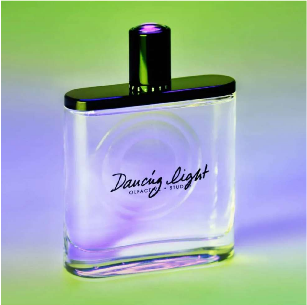
Dancing Light di Olfactive Studio

Dancing Light evoca fasci di luce che iniziano a danzare in compagnia delle stelle. Una coreografia ipnotica trasformata in fragranza grazie alle note di gelsomino, neroli, fresa, sandalo, cedro, cardamomo.