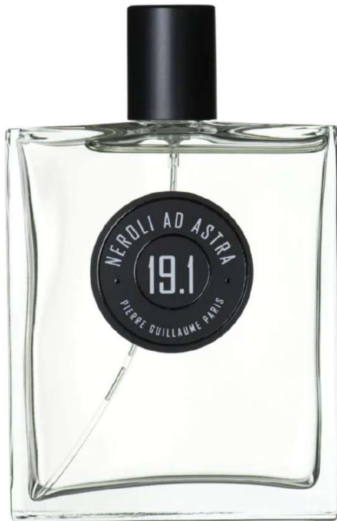
Ad Astra 19.1 di Pierre Guillaume Paris

Ad Astra 19.1 è un floreale bianco, luminoso ed etereo in cui il neroli del marocco e il fiore d'agave del Messico sembrano essere stati raccolti sui campi azzurri di un giardino celeste.