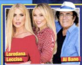
Loredana Lecciso Al Bano

Luca Argentero FAREI SOLO IL PADRE, MA HO IL MUTUO DA PAGARE!