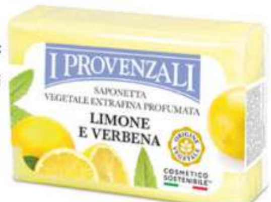
I PROVENZALI: saponetta vegetale limoni e verbena € 2,24