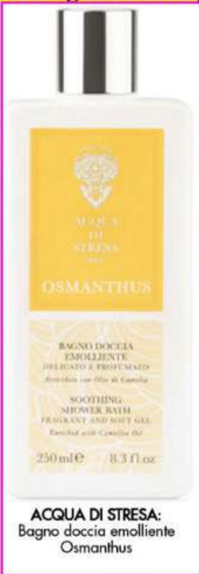
ACQUA DI STRESA: Bagno doccia emolliente Osmanthus