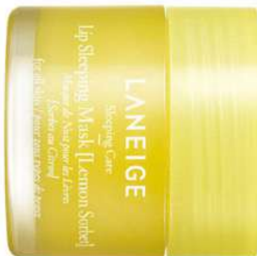
LANEIGE: maschera notte per le labbra sorbetto al limone € 22

L'8 marzo è un giorno particolarmente speciale dell'anno in quanto ricorre la giornata internazionale della donna. Ricordarsene un solo giorno all'anno non è abbastanza, ma è comunque utile. Alleggeriamo questa ricorrenza con un presente che può rendere felice ogni donna: un prodotto beauty! Ecco cinque idee regalo per facilitarvi nella scelta