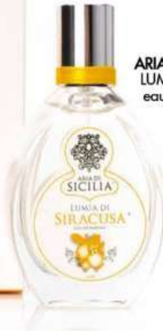
ARIA DI SICILIA: NO.2 LUMIA DI SIRACUSA eau de parfum € 44