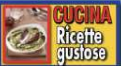
CUCINA Ricette gustose