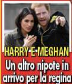
HARRY E MEGHAN Un altro nipote in arrivo per la regina