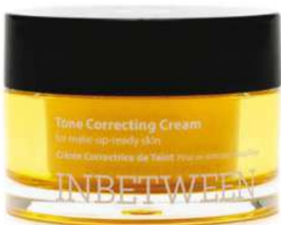
MY BEAUTY ROUTINE: Blithe InBetween crema idratante e primer € 34,50

L'8 marzo è un giorno particolarmente speciale dell'anno in quanto ricorre la giornata internazionale della donna. Ricordarsene un solo giorno all'anno non è abbastanza, ma è comunque utile. Alleggeriamo questa ricorrenza con un presente che può rendere felice ogni donna: un prodotto beauty! Ecco cinque idee regalo per facilitarvi nella scelta