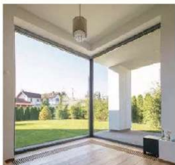
FINESTRA in alluminio Futuro: profili a tre camere e taglio termico [Wisniowski].

Per un mood nordeuropeo, amplifica la luce con infissi ridotti al minimo, bianco assoluto alle pareti e parquet chiarissimo.