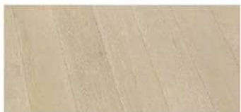
PARQUET in rovere spazzolato Type UV Oil Trafalgar Square [Unikolegno].

Ingredienti naturali per Heather Diffuser, che racchiude un delicato aroma di fiori di erica [Munio € 39]. [EG]