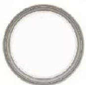
SMALTO all'acqua Multisupporto Expert in Bianco Opaco [V33].