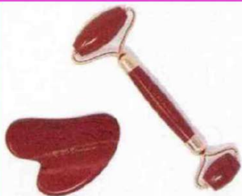
Gua Sha e Roller in Diaspro Rosso di Giada Distributions (€ 32,50): la "pietra dei guerrieri" è indicata per le pelli mature, spente e con problemi di circolazione.