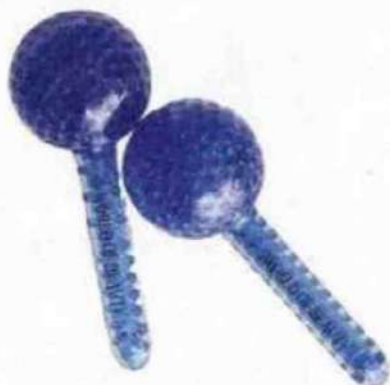
Akemy Blue Sphere di World of Beauty (€ 80,00): sfere criogeniche in vetro per massaggi caldi/freddi leniscono la pelle, anche con rosacea, e migliorano la microcircolazione.

Alicia Keys, 40 anni, cantautrice e musicista statunitense, ha fondato il marchio beauty clean Keys Soulcare. Tra i prodotti, Obsidian Facial Roller (€ 26,99), in pietra ossidiana naturale, serve a massaggiare il viso e applicare i prodotti skincare.