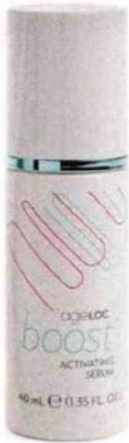
AgeLOC Boost con Activating Serum di Nuskin (€ 344,06): con tecnologia a microcorrente pulsata, associata al siero, rende più luminosa la pelle in soli 2 minuti al giorno.