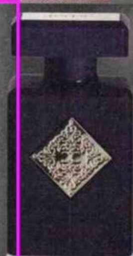
Narcotic Delight EdP di Initio Parfum Privés

Fragranza speziata gourmand con hedione che, secondo gli studi, attiva le aree del cervello deputate alle emozioni. 90ml 255 €.