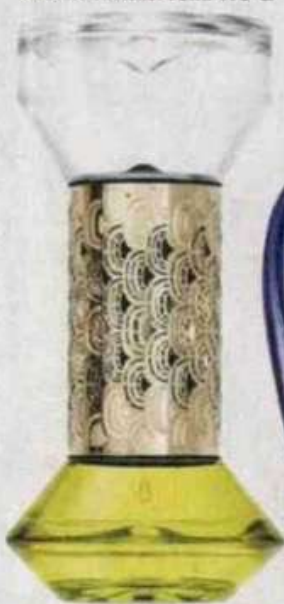
Sablér Mimosa di Dptyque Paris Capovolgendo la clessidra nell'ambiente si diffonde un aroma mielato. 75ml 173 €.

Fragranza speziata gourmand con hedione che, secondo gli studi, attiva le aree del cervello deputate alle emozioni. 90ml 255 €.