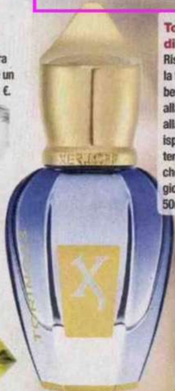
Torino 23 EdP di Xerjoff

Risveglia i sensi con la freschezza del bergamotto associato alla rosa, al cardamomo e alla tuberosa. Un profumo ispirato al torneo di tennis Nitto ATP Finals che riunisce gli 8 migliori giocatori del mondo. 50ml 180 €.