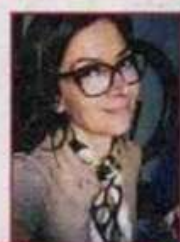
di Francesca Marotta

Si chiama Esxence l'evento dedicato alle creazioni olfattive innovative che si svolge a Milano dal 6 al 9 marzo. Rappresenta l'occasione per conoscere un universo affascinante