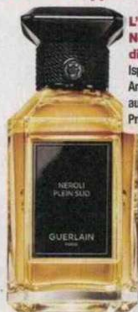
L'Art & La Matière Nérolí Plein Sud EdP di Guerlain

Lo scorso anno gli approfondimenti hanno riguardato le fragranze che parlano all'anima, spesso dominate da note vivificanti o rilassanti che migliora-