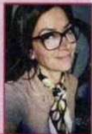
di Francesca Marotta