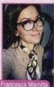
di Francesca Marotta