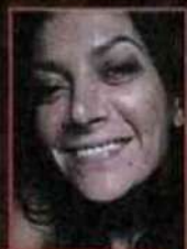
di Francesca Marotta