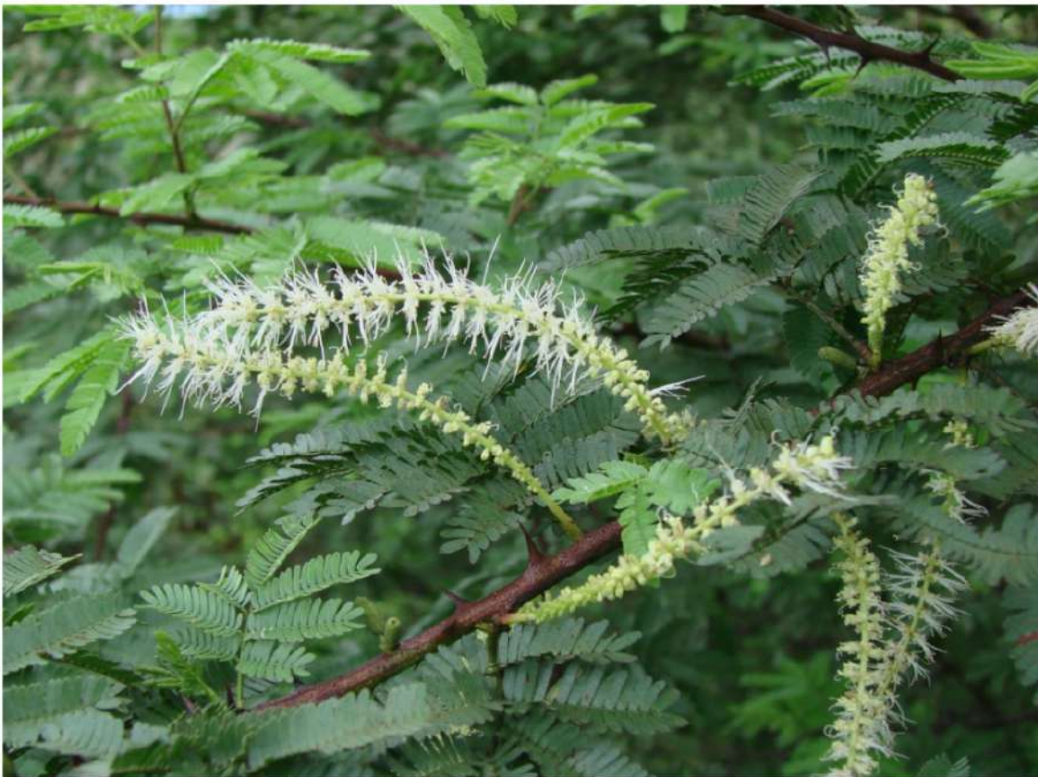
Mimosa tenuiflora (Jurema), Bahia, Brasile

In terzo luogo, la combinazione di note fragranti comuni con piante psicoattive brasiliane selezionate. Beh, la nota di cannabis è usata abbastanza spesso nella profumeria di nicchia (si veda la collezione Cannabis di BOIS 1920, Ganja di Comme des Garçons, Kinski, Ganja Oud di Jul et Mad, Amsterdam Intense di Jazeel, ecc.), ma ho dovuto indagare sui fiori di Jurema menzionati nella piramide olfattiva di ITABAÏA 29 .