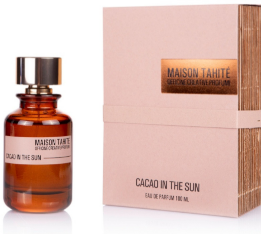
Cacao in The Sun di Maison Tahité

È più luminosa e tropicale la firma di Cacao in The Sun di Maison Tahité che evoca una spiaggia bianca e paradisiaca: la scia perfetta per allontanare lo stress della frenesia quotidiana e per evadere anche solo con il pensiero. Nel suo cuore, la nota di cioccolato è ammorbidita da iris, fiori d'arancio e mughetto. Il tocco gourmand è dato, invece, dalla vaniglia sul fondo.