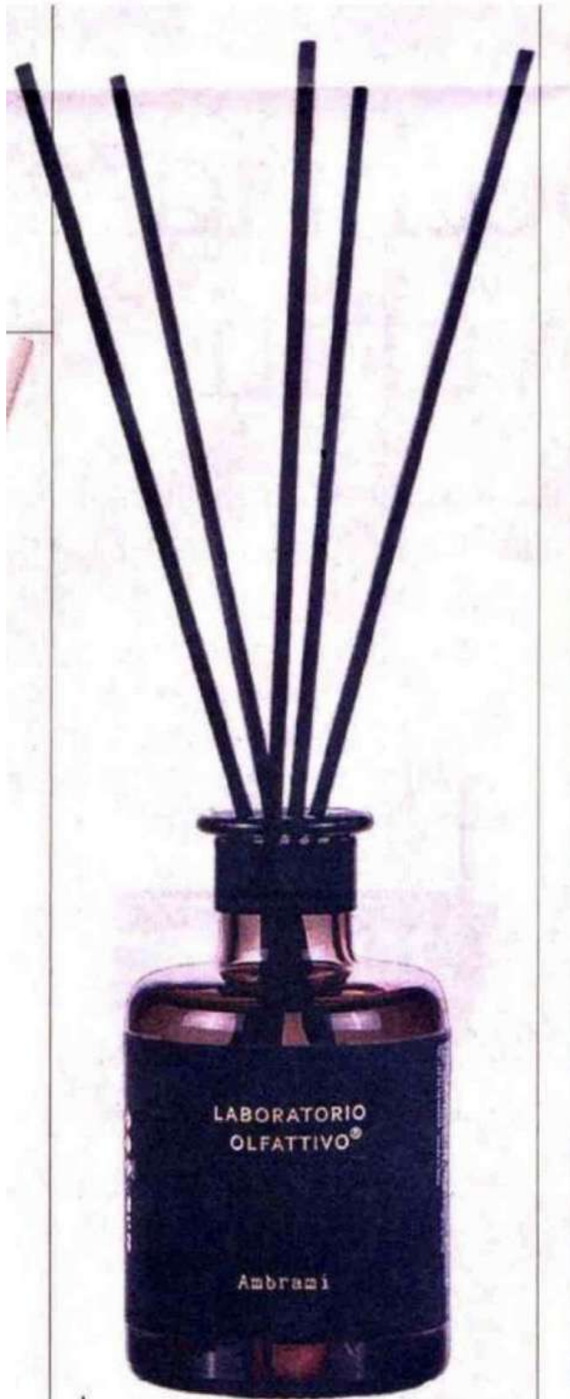
Laboratorio Olfattivo. Ambrami, caldo e rassicurante