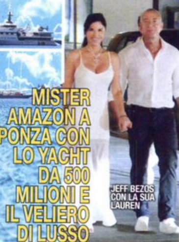
JEFF BEZOS CON LA SUA LAUREN

GRANDI ESCLUSIVE: VACANZE ITALIANE PER DICAPRIO E BEZOS