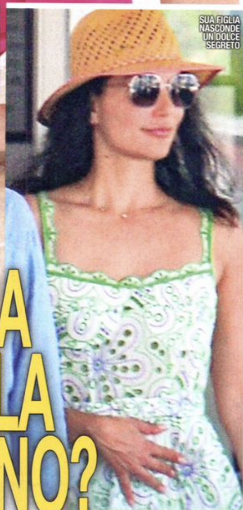
SUA FIGLIA NASCONDE UN DOLCE SEGRETO