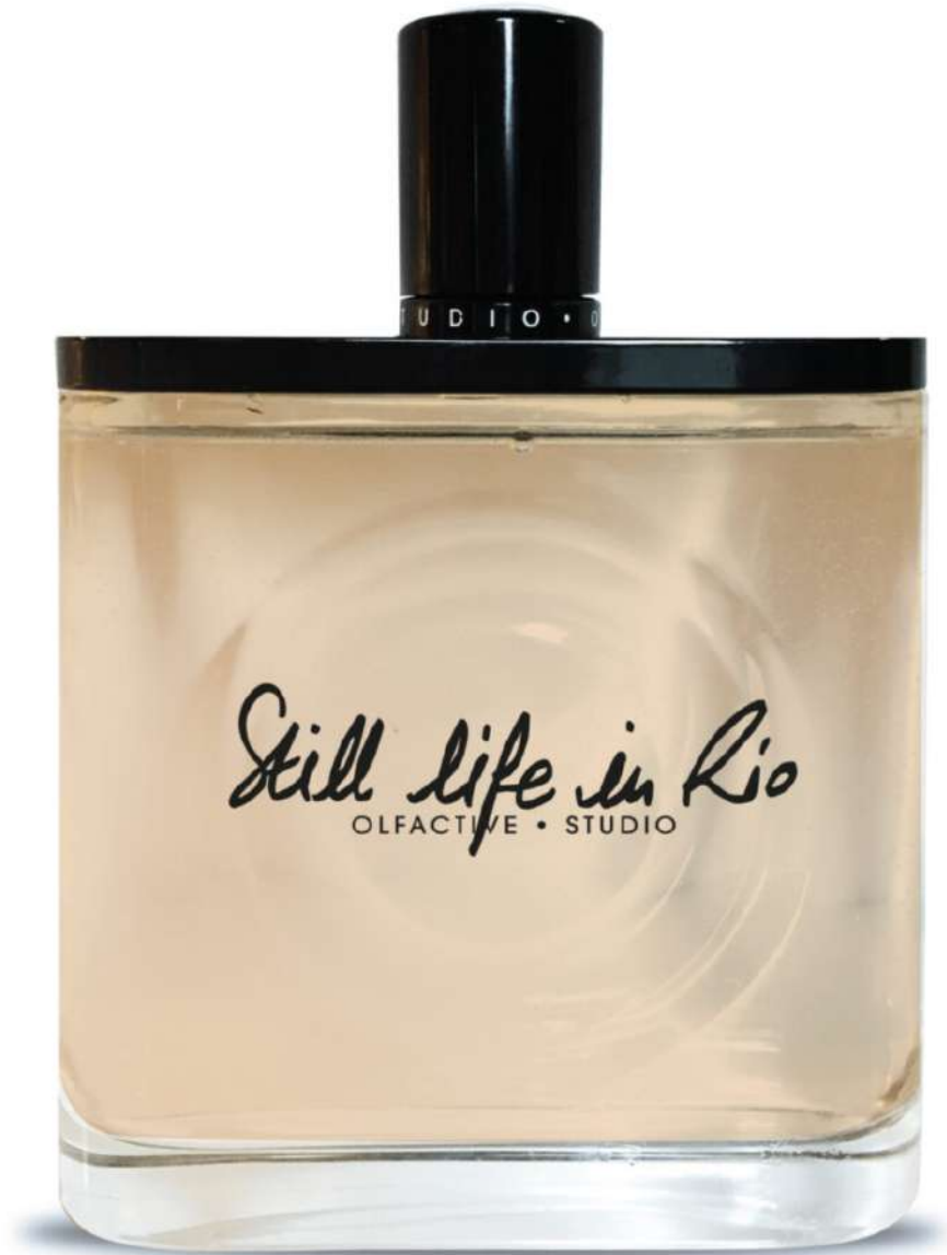
Still life in Rio, Olfactive Studio

Immaginate l'estate, le vacanze, la spiaggia, il mare cristallino del Brasile e voi che sorsegiate in relax un cocktail che è uno splash di dolce freschezza , avete sicuramente vaporizzato sulla vostra pelle Still life in Rio . Questa fragranza di Olfactive Studio è esotica luminosa , strepitosamente piacevole per la pelle e per il cuore. Il profumo si apre con le note di Yuzu, zenzero, menta ed essenza di limone per un'ondata di pura freschezza. Il cuore si riscalda come la vostra pelle baciata dal sole con un accordo di pepe, peperoncino piccante e acqua di cocco. Il fondo è sensuale e caldo con le note di legno di Rum e di Copahu Brasiliano.