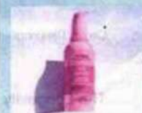
Aveda. Nutriplenish Replenishing Overnight Serum, siero notturno idratante