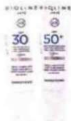
Bioline Jato. La linea Sundefense si arricchisce con una formulazione per i bambini e due Crema Fluide Viso con Spf 30 e 50+ utilizzabili tutto l'anno