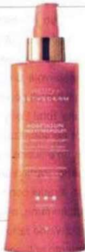
Institut Esthederm. Adaptasun Mer et Tropiques Lait Protecteur Corps