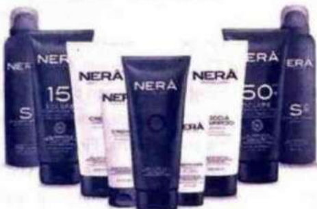
Nera Pantelleria. Linea di solari remineralizzanti e tonificanti con pietra vulcanica ed estratto di mirto nero