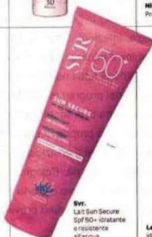
Svr. Lait Sun Secure Spf 50+ idratante e resistente all'acqua