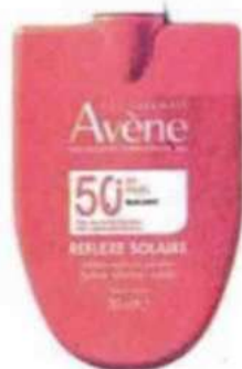
Avene. Reflexe Solaire Spf 50+ per neonati, bambini e adulti.