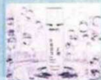
Morphosis. Restructure Hair Beauty Elixir, maschera intensiva rigenerante per capelli danneggiati

Focus capelli Maschere rigeneranti, acque districanti, sieri idratanti e fortificanti, oli nutrienti e scrub per il cuoio capelluto: le novità per prendersi cura dei capelli