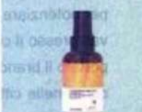
Elgon. Colorcare Suncare Hair & Body Oil, olio secco multiuso idratante per corpo e capelli