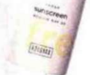
Korff. 365 Protection Spf 50+ Siero viso idratante e antiossidante