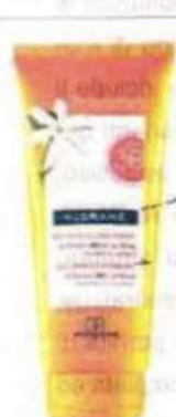
Klorane. Polystanes Gel-Crème Solaire Sublime visage & corps Spf 30