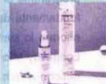
Medavita. Fortifying & Regenerating Hair Kit con lo shampoo Lotion Concentrée e il siero Elisier